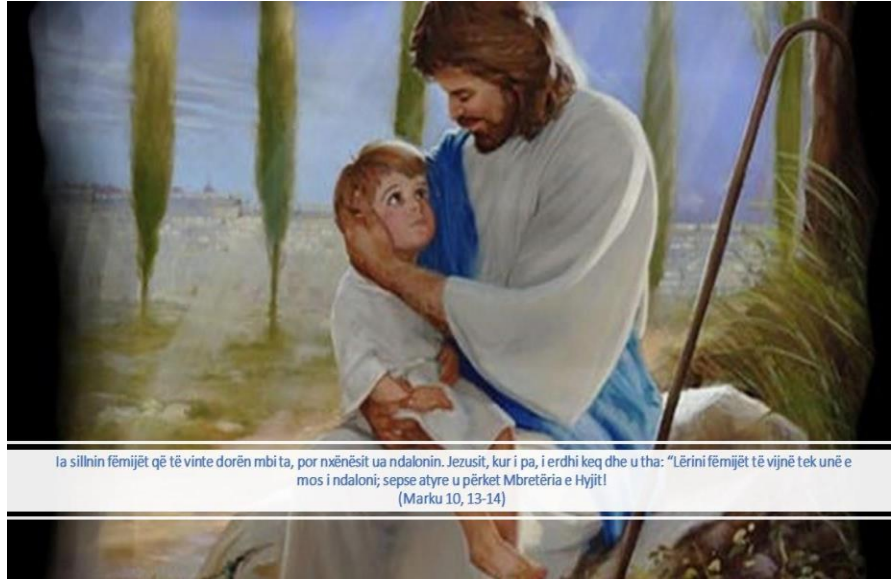
Ia sillnin fëmijët që të vinte dorën mbi ta, por nxënësit ua ndalonin. Jezusit, kur i pa, i erdhi keq dhe u tha: “Lërin fëmijët të vijnë tek unë e mos i ndaloni; sepse atyre u përket Mbretëria e Hyjit! (Marku 10, 13-14)

“Ia sillnin fëmijët që të vinte dorën mbi ta, por nxënësit ua ndalonin. Jezusit, kur i pa, i erdhi keq dhe u tha: “Lërin fëmijët të vijnë tek unë e mos i ndaloni; sepse atyre u përket Mbretëria e Hyjit!” (Marku 10, 13-14)